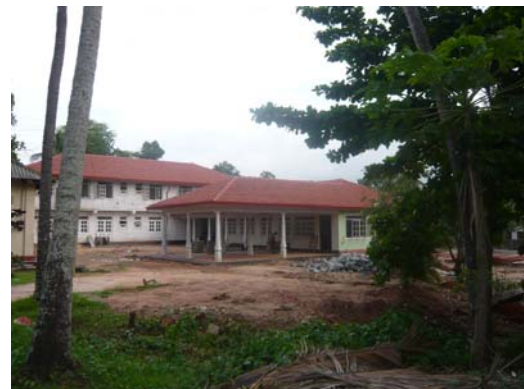
3 Mei 2014: Het Lourdes Girls Home van een afstand gefotografeerd