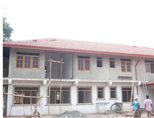
21 Maart 2014: Buitenzijde Lourdes Girls Home in aanbouw, 10 maanden na de start van de bouw.