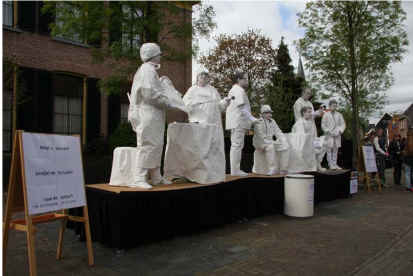
De groep beelden in Borne