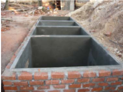
22 Februari 2014: Bouw van de toiletput.

Ook u kunt in deze Nieuwsbrief de vorderingen bekijken.