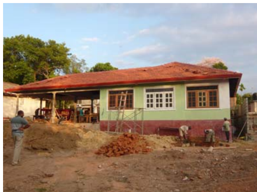
21 Maart 2014: Lourdes Girls Home in aanbouw. De buitenzijde wordt geschilderd.