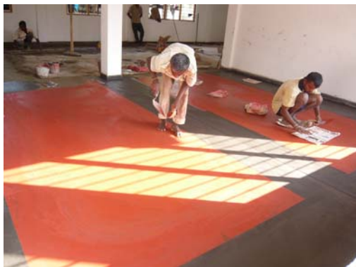
5 Maart 2014: De vloeren worden gelegd.