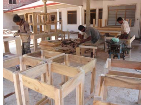
22 Februari 2014: De meubels voor het Lourdes Girls Home worden gemaakt.