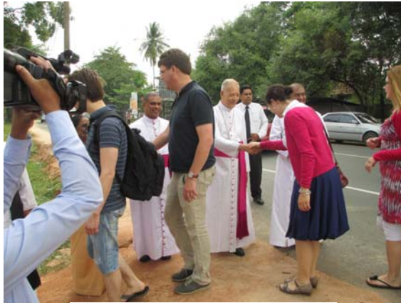
11 Juli 2014: Een warm welkom voor de gasten uit Nederland.