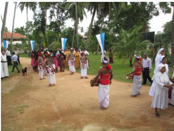
De Kandy Dancers luisteren het feest op met muziek en dans.