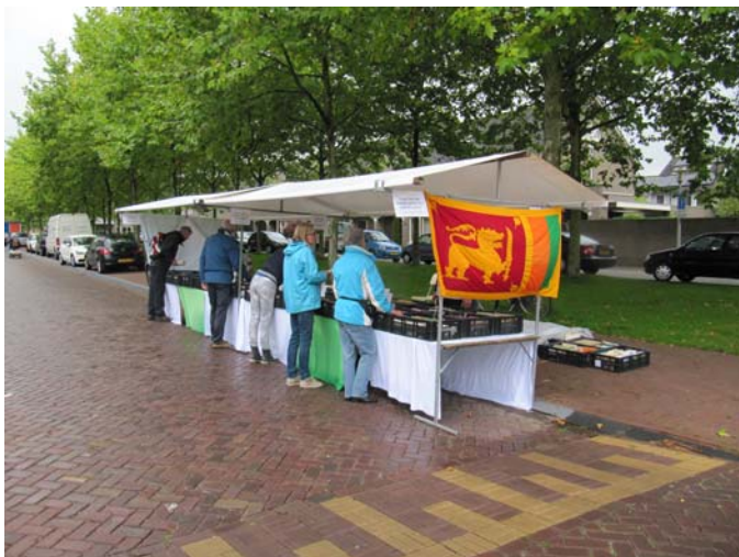
Ondanks de regen wisten de echte boekenliefhebbers de stand wel te vinden.

Op zaterdag 30 augustus werd de Boekenmarkt in Borne gehouden, als onderdeel van de Melbuul'n dagen. In de weken ervoor hadden veel mensen boeken geschonken. Vier vrijwilligers sorteerden de boeken op genre. De zaterdag begon zeer regenachtig, maar het lukte toch om de boeken uit te stallen op de twee stands. Alles bleef droog. Ook achter de stand stond een grote rij kratten met boeken op zoek naar een koper. De belangstelling 's morgens was gering door een fout in de programmakrant, die aangaf dat het om 12.00 uur zou beginnen. 's Middags werd het wat drukker maar de felle regenbuien zorgden geregeld voor lege straten. De boeken waren veilig afgedekt en er vormden zich plassen op het plastic. Maar alle vrijwilligers, waaronder ook twee bestuursleden, bleven opgewekt. Aan het einde van de dag bleek de opbrengst verrassend mee te vallen. De opbrengst is geschonken aan de stichting. De vrijwilligers bedanken alle mensen die boeken hebben geschonken of gekocht en hen die een gift doneerden.