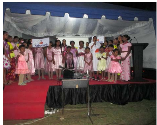
De meisjes zingen en dansen voor de zo belangrijke gasten uit Nederland, die hen een thuis hebben geschonken.