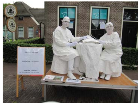
Chirurgen zitten klaar voor patiënten