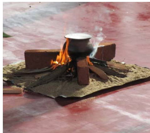
Als de kokosmelk overkookt, kan het huis geopend worden.