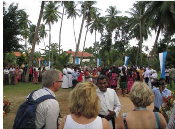
De kinderen zijn aanwezig bij de opening. Zij gaan in het nieuwe Lourdes Girls Home wonen.